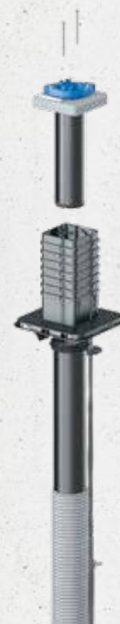
Quadro-Sicura® Nova R1